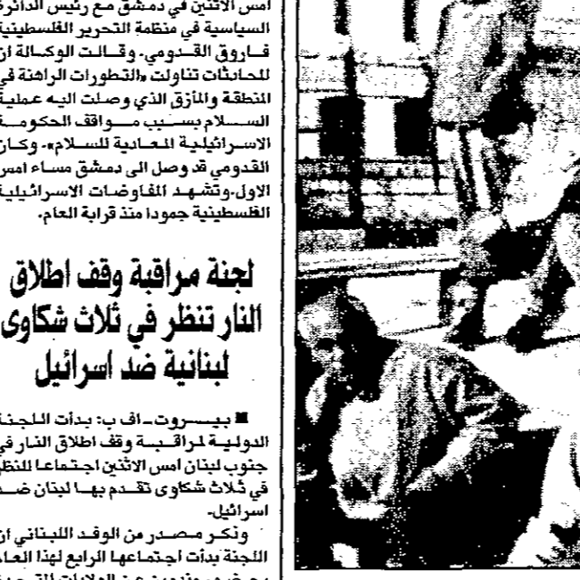
مهاجرون بعد وصولهم الى ايطاليا

سوفيقية سابقة حيث الطلب على الهجرة غير الشرعية مرتفعة، واعلنت مصادر السبل التالي لسفر الكثيري التي جابت المهاجرين لسفر التكريتي التي يوهان العام للمضي، واول سفينة كانت بتاريخ 1997 محملة ب285 شخصا في 20 مايو) غادرت سفينة اخرى محملة ب200 شخص وفي 18 حزيران (يونيو) غادرت سفينة اخرى تحمل 743 مهاجرا، واخرى في 24 اب (اغسطس) بحملة مهاجرة و13 تشرين الاول (اكتوبر) نقلت سفينة اخرى 400 مهاجر وفي 2 تشرين الثاني (نوفمبر) 800 راكب وفي 27 كانون الاول (ديسمبر) اقلت سفينة عرارات 835 مهاجرا وفي اول كانون الثاني (يناير) من العام 1998 اقلت سفينة كوميتا على يد عدايا معروف من المهاجرين وبها 2500 سفينتين آخرين تسعدان للاسراع خلال اسابيع عدة وتنتشر سحاياق نوبيات شرقة السواحل في البحر الابيض المتوسط.